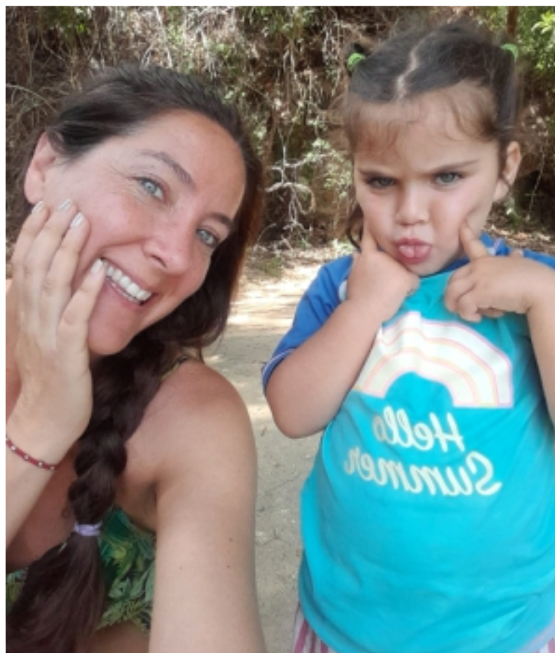
Amandinha em forma teatral sabe representar suas diversas facetas. A mãe se realiza com a menina.