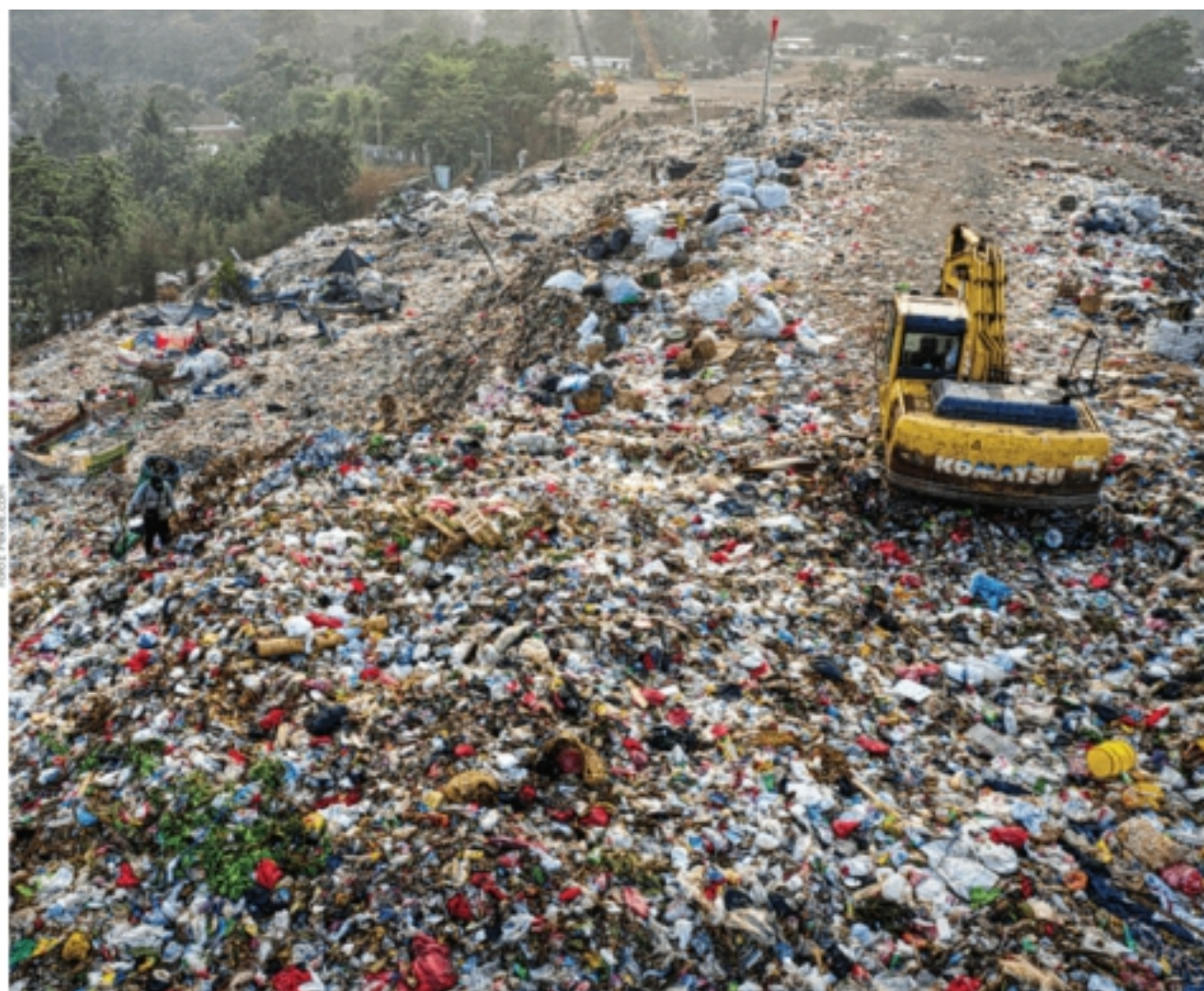
O desastroso visual do descartável Foto Revista Portal

Limpe e amasse as embalagens Certifique-se que o saco está bem fechado e embalado.